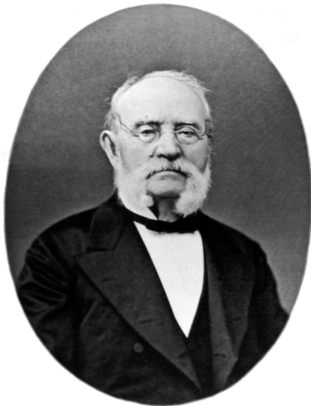
Илл. 2. Георгий Ефимович Щуровский (1803–1884)

Благодаря объединенным усилиям был разработан устав, в котором целью создания Общества любителей естествознания было объявлено «изучение губерний Московского учебного округа в естественно-историческом отношении» и «распространение естествознания в массе публики» [Протоколы... 1866]. При этом в круг предметов занятий Общества вошли: «1) собираение естественных предметов и произведений в губерниях Московского Учебного округа и составление систематической коллекции оных при зоологическом и минералогическом музеях Московского университета ; 2) описание новых и интересных форм животных, растений и минералов как поступающих в университетские музеи, так и уже находящиеся в них ; 3) приобретение коллекций животных и минералов, не достающих в систематических собраниях музеев и важных в научном отношении, равно, как и специально зоологических и минералогических сочинений, необходимых для определения и изучения предметов органических царств ; 4) составление экскурсий и экспедиций для собирания естественно-исторических предметов ; 5) издание систематического описания губерний Московского